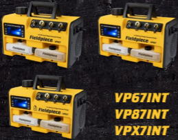
VP67INT VP87INT VPX7INT